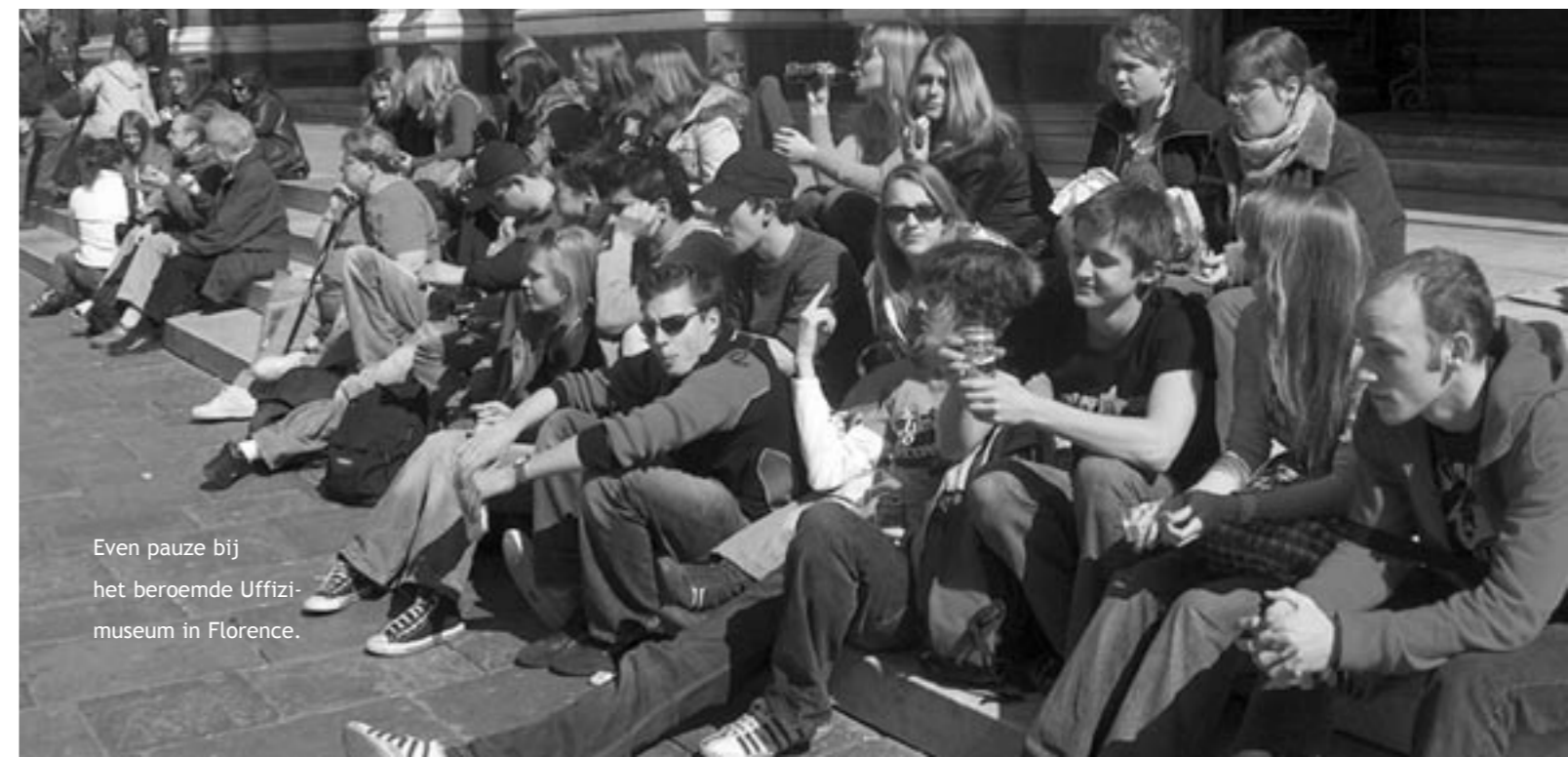
Even pauze bij het beroemde Uffizi-museum in Florence.

bus, al lekker warm, op ons wacht om terug naar Urbino te gaan. Ja, ja bella Italia, maar de zon krijgen we niet te zien, wel storm, regen, sneeuw, mist en andere nattigheid! Ons volgende bezoek is Perugia en Assisi. Perugia ligt in het hart van Italië, in Umbria. Perugia is een stad van kunst en cultuur en tevens een behoorlijk grote stad met veel industrie er omheen. Het historische centrum ligt hoog op de heuvels, zoals alle steden van betekenis hier. Een prachtig centrum met het Palazzo dei Priori, de Fontana Maggiore en de San Lorenzo kathedraal. Er zijn nog veel meer bezienswaardigheden, maar voor een kleine twee uur is dit wel genoeg. Hoewel een aantal jaren geleden behoorlijk getroffen door