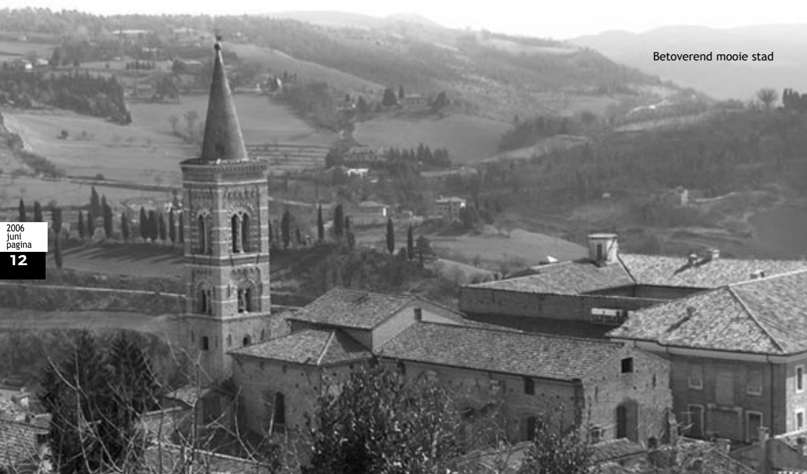
Betoverend mooie stad