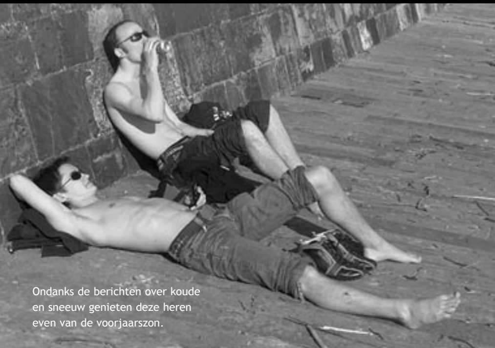
Ondanks de berichten over koude en sneeuw genieten deze heren even van de voorjaarszon.